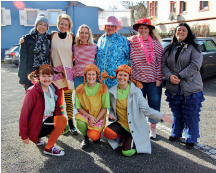
Die ErzieherInnen-Teams beider evangelischer Kindergärten haben den Gottesdienst gemeinsam mit den Kindern kunterbunt vorbereitet.