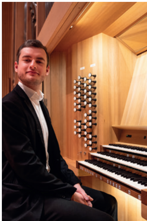
Organist Bernhard Hauk

Musikhochschule Freiburg zugelassen, eine Art musikalische Förderung, die man schon zu Schulzeiten genießen kann.