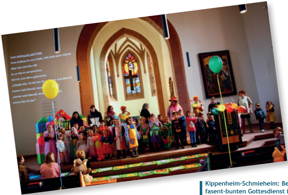
Kippenheim-Schmieheim: Beim fasant-bunten Gottesdienst in der Friedenskirche kam Pippi Langstrumpf zu Besuch.